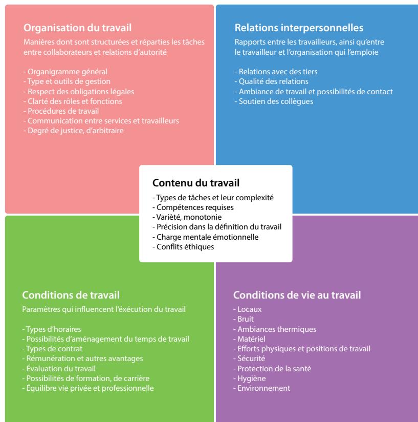
Figure 1 Descriptions par catégorie des risques psychosociaux au travail 25